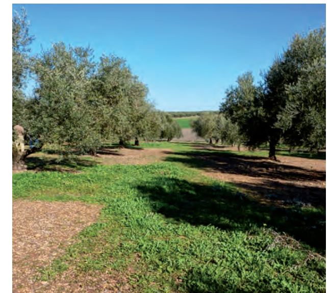
Eficacia de Ruedo 4 meses después de la aplicación.