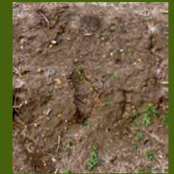
Malas hierbas en dos hojas

Para obtener la mejor eficacia, aplicar Ruedo con el terreno en tempero o cuando se esperen lluvias tras la aplicación.