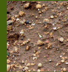
Malas hierbas en punto verde

El momento óptimo para aplicar Ruedo va desde "punto verde", cuando las hierbas dicotiledóneas no han emergido aún, pero empiezan a romper la costra del suelo, hasta que tienen dos hojas.