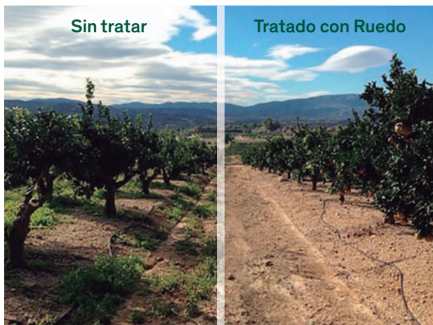
Eficacia de Ruedo 90 días después de la aplicación.

Suelos sin malas hierbas durante más tiempo. Una aplicación de Ruedo permite mantener su plantación libre de nascencias de malas hierbas dicotiledóneas durante más tiempo.