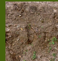
Malas hierbas en dos hojas

Para obtener la mejor eficacia, aplicar Ruedo con el terreno en tempero o cuando se esperen lluvias tras la aplicación.