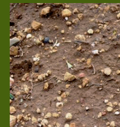
Malas hierbas en punto verde

Aplicar en primavera, desde el estado de yemas en reposo hasta el cambio de color del fruto.